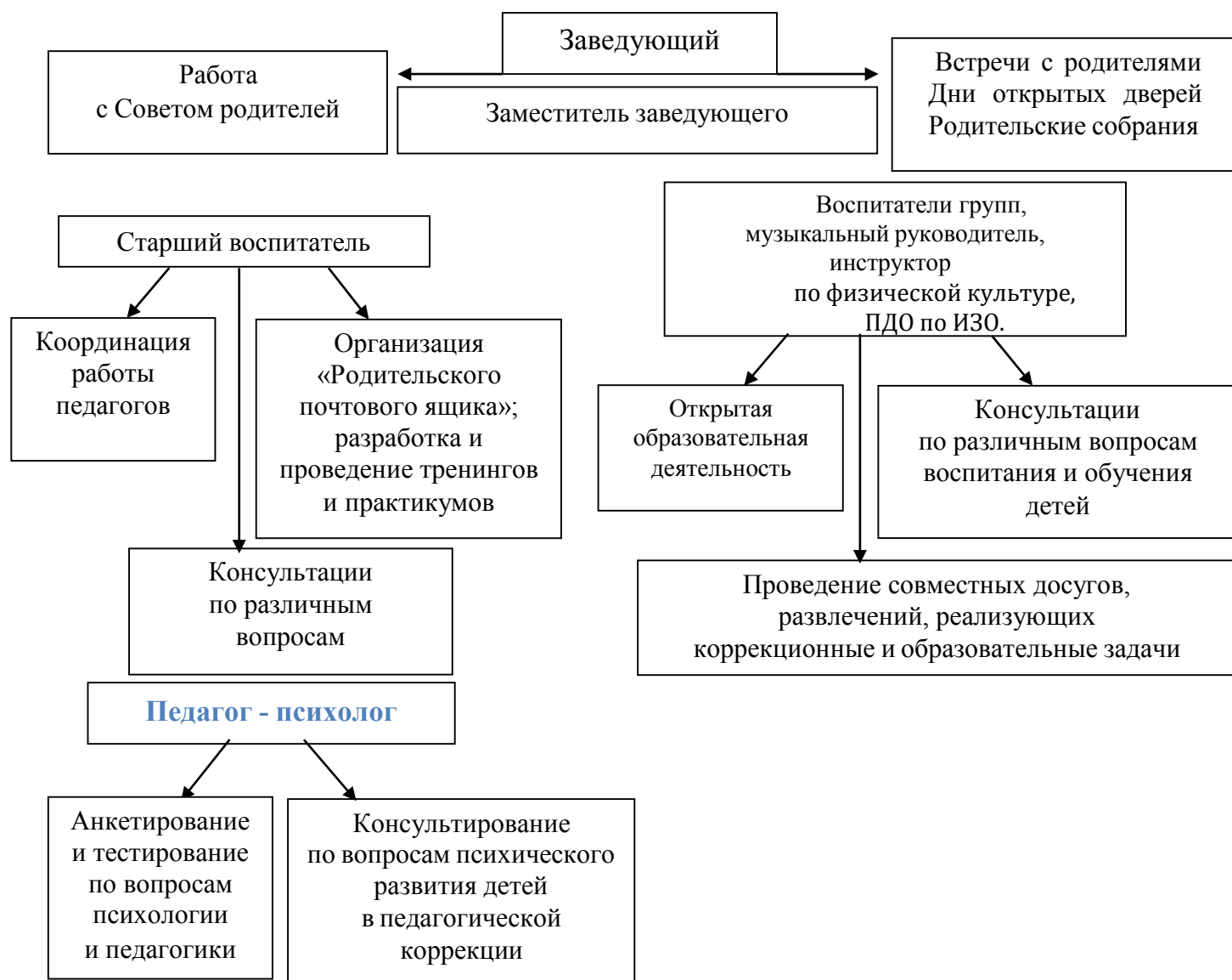
Рис. 1 «Схема взаимодействия с семьями воспитанников»