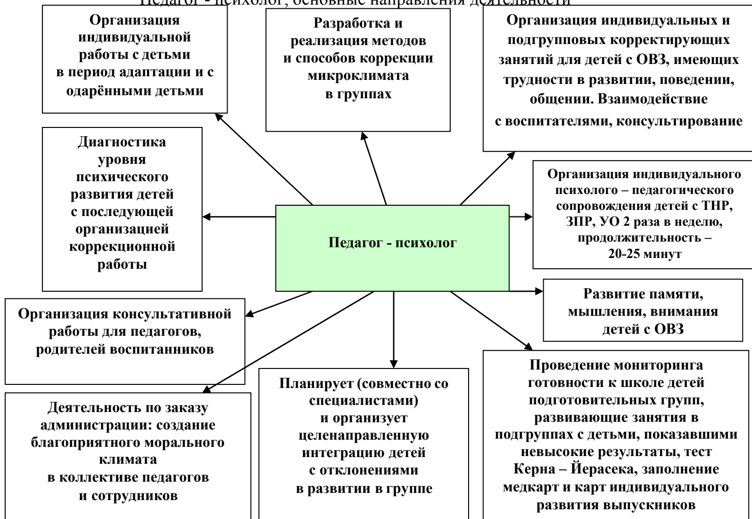
Рис. 2 «Педагог - психолог, основные направления деятельности»